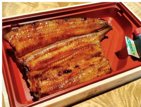
8. うなぎ蒲焼 4,400円(税込4,752円)