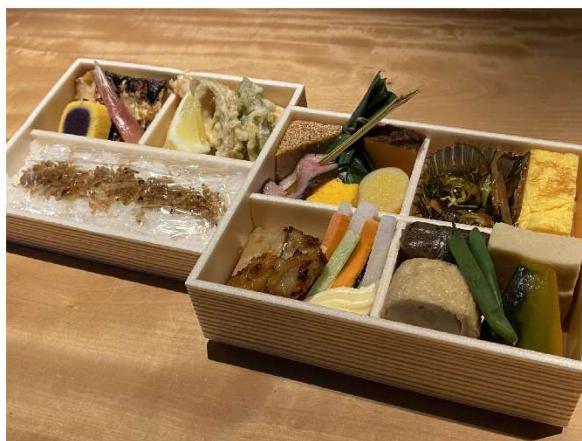
1. お弁当 3,000円(税込3,240円)