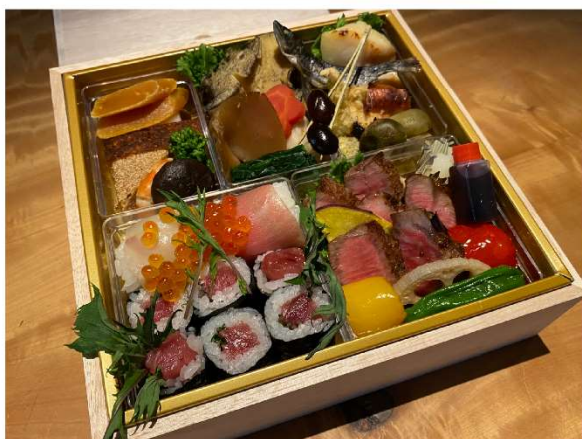
4. お弁当 7,500円(税込8,100円)