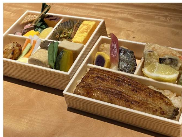
2. お弁当 (鰻半身入) 5,100円(税込5,508円)