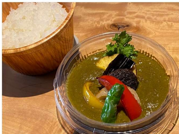
7. カレーライス 1,600円(税込1,728円)