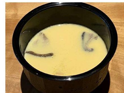
9. 茶碗蒸し 600円(税込648円)