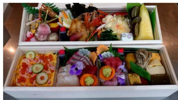
5. お弁当 10,500円(税込11,340円)