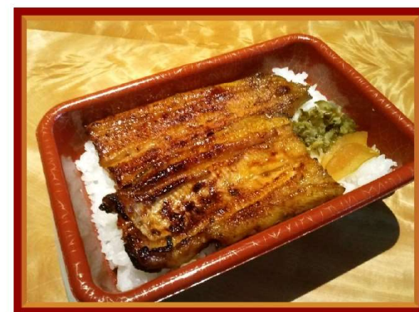
6. うな重 5,300円(税込5,724円)