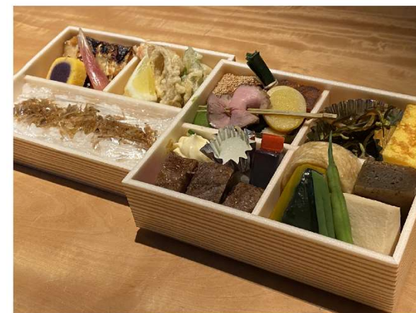
3. お弁当 (肉入り) 5,800円(税込6,264円)