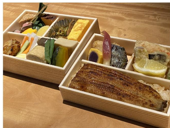
2. お弁当 (鰻半身入) 5,100円(税込5,508円)