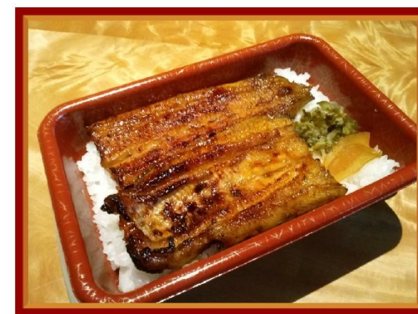
6. うな重 5,300円(税込5,724円)