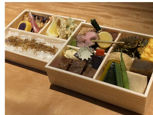
3. お弁当 (肉入り) 5,800円(税込6,264円)