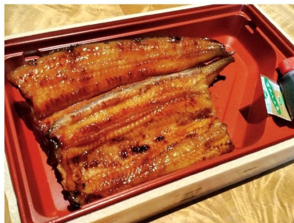
8. うなぎ蒲焼 4,400円(税込4,752円)