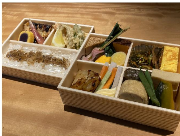
1. お弁当 3,000円(税込3,240円)