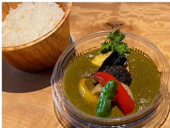
7. カレーライス 1,600円(税込1,728円)