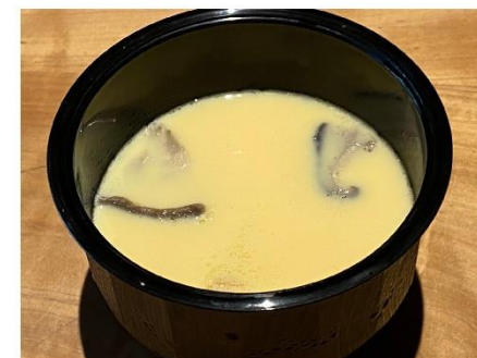
9. 茶碗蒸し 600円(税込648円)